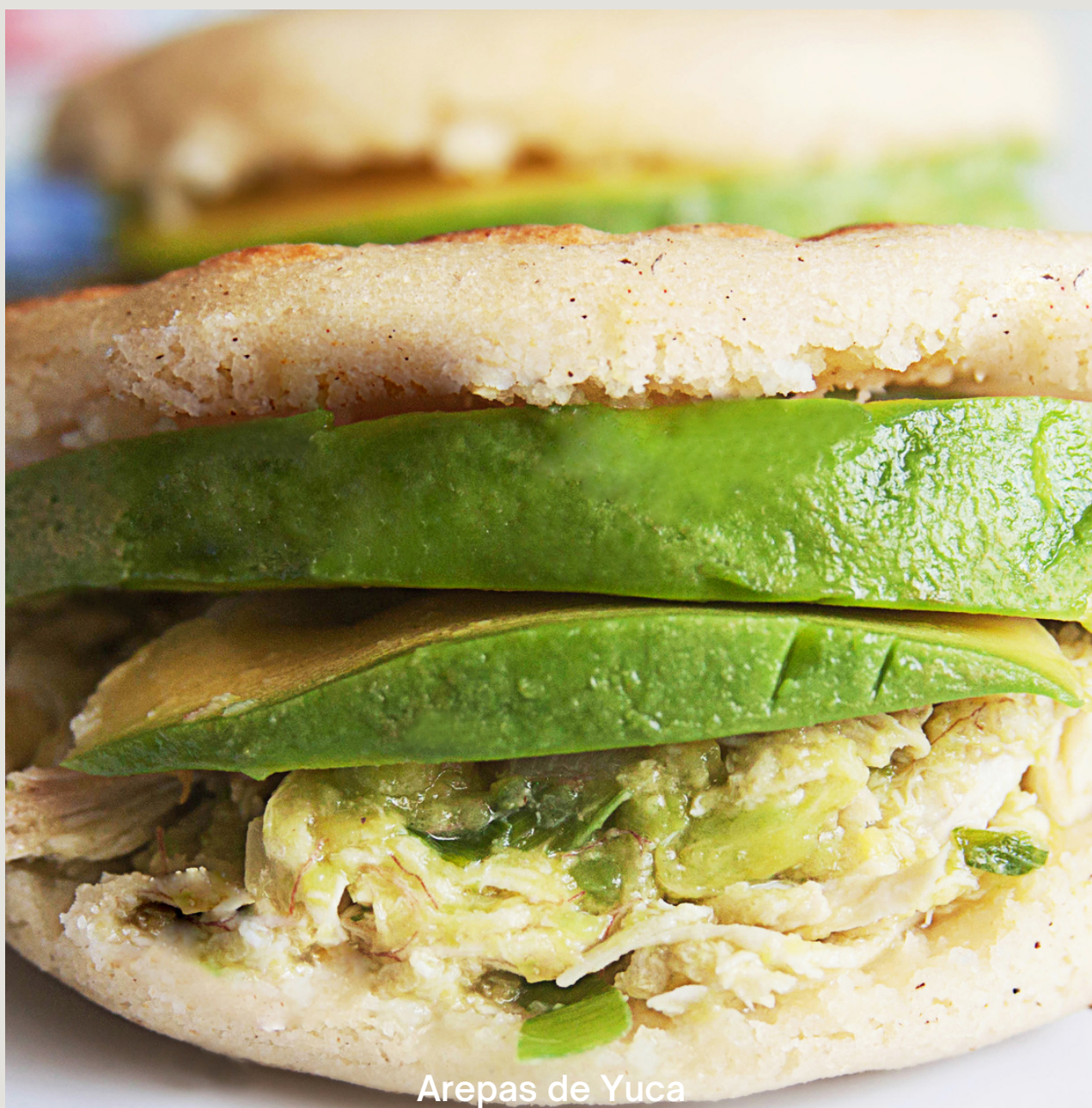
Arepas de yuca rellenas de aguacate, pollo desmechado y salsa de yogur de coco.